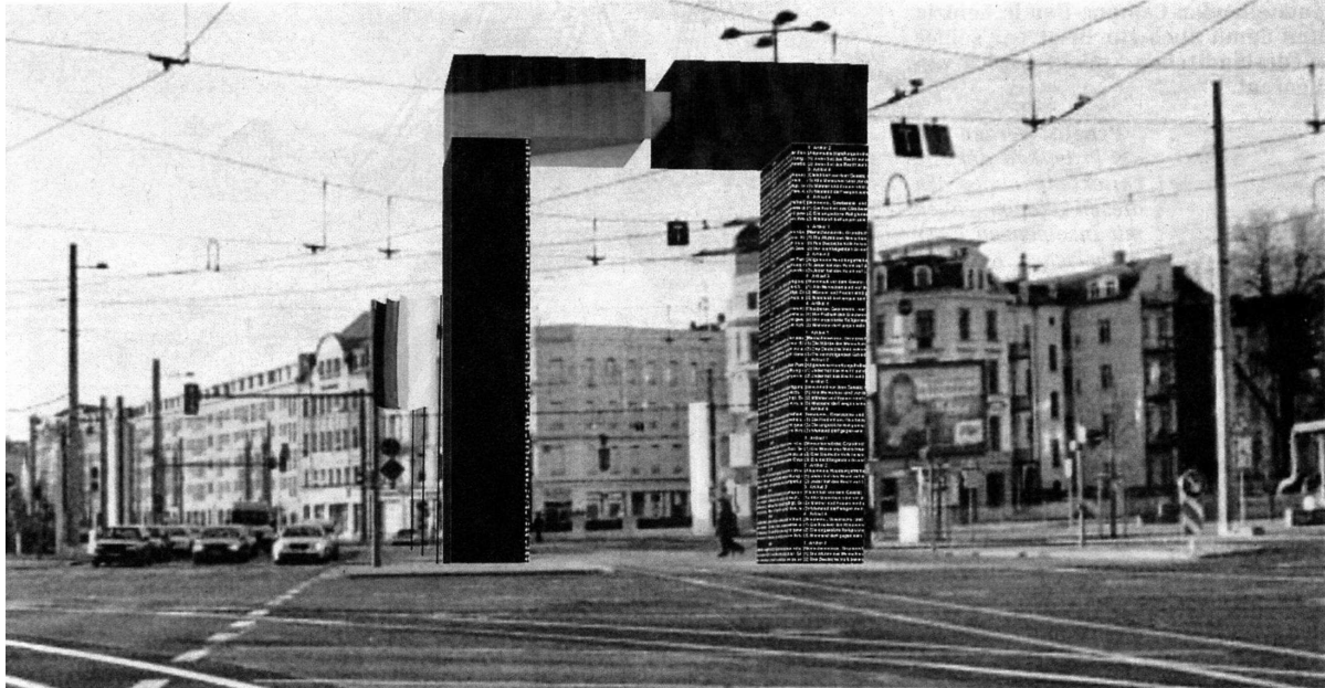
nz Stöpel und seine Mitstreiter ein Tor aus Stahl, Glas und Licht platzieren.