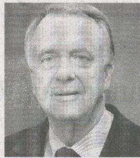
Kulturstaatsminister Bernd Neumann: Kosten prüfen.

„Ich nehme den Auftrag sehr ernst und werde schon in Kürze entsprechende Gespräche darüber führen“, sagte Neumann. „Wir wollen nichts aufkotzen und erwarten daher die Vorschläge