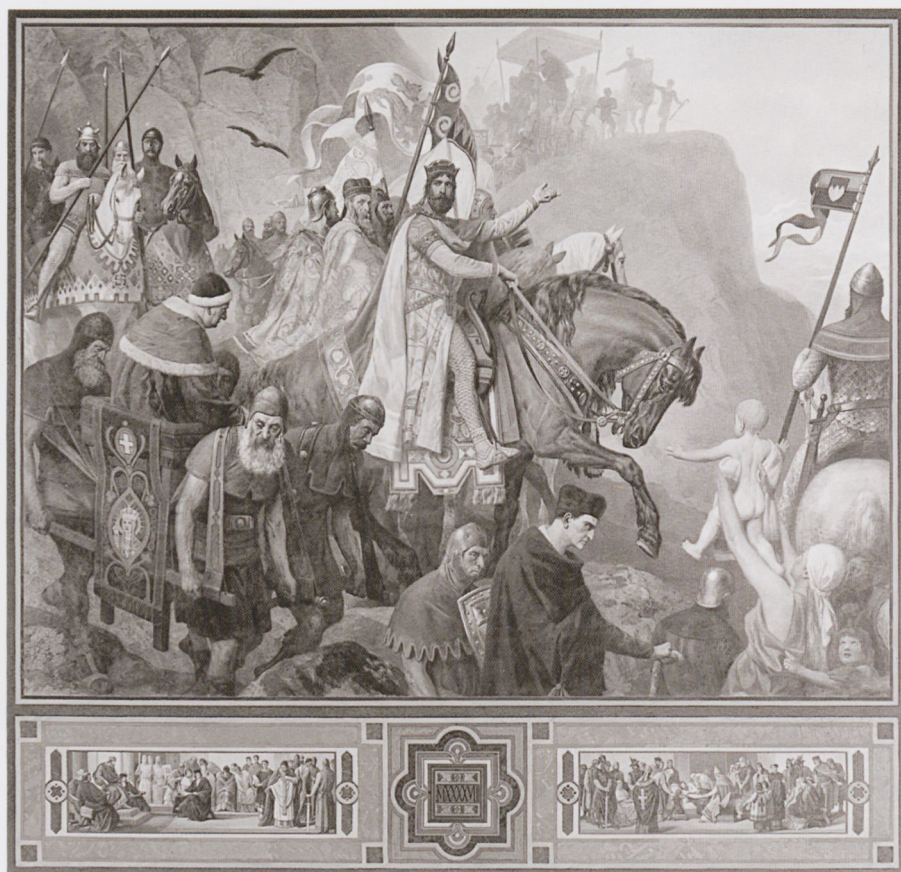
4 Kaisersaal der Kaiserpfalz in Goslar Aufnahme um 1900