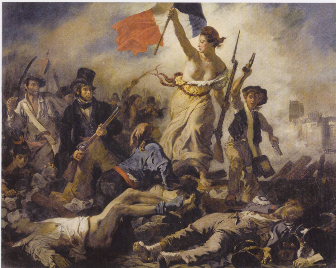
1 Eugène Delacroix Barrikadenszene (Die Freiheit führt das Volk) , 1830 Öl auf Leinwand, 260 cm × 325 cm Paris, Musée du Louvre

Märchen und mythenhaften Inhalten gelingt es bis heute, sich auf direktem Weg in die Seelen der Betrachter einzuschmeicheln. Das dürfte in erster Linie mit der Tatsache zu tun haben, dass sie sich in ihrer Fantastik dem nüchternen Alltag der modernen Produktionsgesellschaft entziehen. Märchen erwecken Erinnerungen an die Kindheit, sie gelten als gegenwartsentzogen und irgendwie tröstlich, obwohl ja gerade auch die Grimmschen Märchen nicht mit Grausamkeiten und Blutrünstigkeiten sparen – eine Tatsache, die übrigens zu lebhaften Diskussionen unter heutigen Pädagogen geführt hat, ob man solche eigentümlichen Texte unseren Kindern überhaupt noch zumuten sollte. Die Erfahrung des 19. Jahrhunderts ist unter dem Eindruck von der Entzauberung der Welt, die durch Aufklärung im 18., Darwinismus im mittleren 19. und Psychoanalyse im späteren 19. Jahrhundert angebahnt wurde und Fragen nach einer Letztbegründung obsolet werden ließ, eine radikal verweltlichte. Mythische und märchenhafte In-