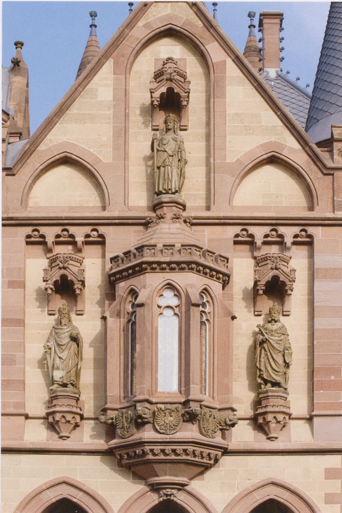
9 Südfassade von Schloss Drachenburg mit den Figuren Cäsars, Kaiser Karls des Großen und Kaiser Wilhelms I. von Peter Fuchs, 1884 Königswinter, Schloss Drachenburg