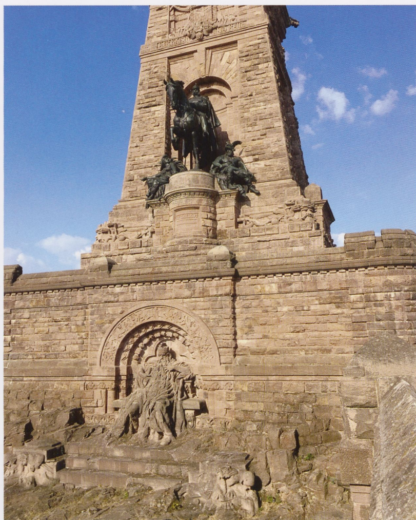
8 Kyffhäuserdenkmal mit Kaiser Wilhelm I. und Kaiser Friedrich I. Barbarossa, 1896 Naturpark Kyffhäuser

der Ort selbst bot ein Höchstmaß an romantischem Projektionspotenzial, repräsentierte er doch als Bau des Mittelalters eine Zeit, in der Deutschland noch ungeteilt und mächtig war: Die Pfalz galt als größter Profanbau seiner Zeit und diente im 11. Jahrhundert vor allem den salischen Kaisern als Aufenthaltsort (Abb. 4). Über Jahrhunderte dem Verfall ausgesetzt, wurde dieses umfangreiche Gebäudekonglomerat seit den späten 1860er-Jahren restauriert und zum Symbol für das wiederauferstandene Reich. Die Wiederauferstehungsideologie kann im Übrigen als Schlüssel für die gesamte Ikonografie und Bedeutung der Mythenrezeption im Kontext der Bildung des neuen Deutschen Reiches dienen. Nicht vergessen werden sollte in diesem Zusammenhang, dass Goslar am Fuße des Harzes liegt, einem zentralen Entstehungsort sehr deutscher Mythen, die sich keinesfalls auf die Hexentänze beschränken, die wir aus der Faust-Sage kennen. Der umfangreiche Gemäldezyklus erinnert in seinem