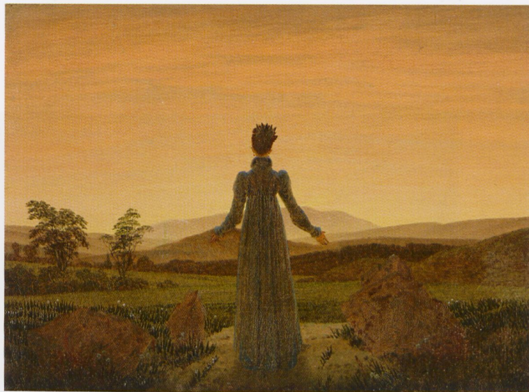
2 Caspar David Friedrich, Frau vor der untergehenden Sonne , um 1818 Öl auf Leinwand, 22 × 30,5 cm Essen, Museum Folkwang