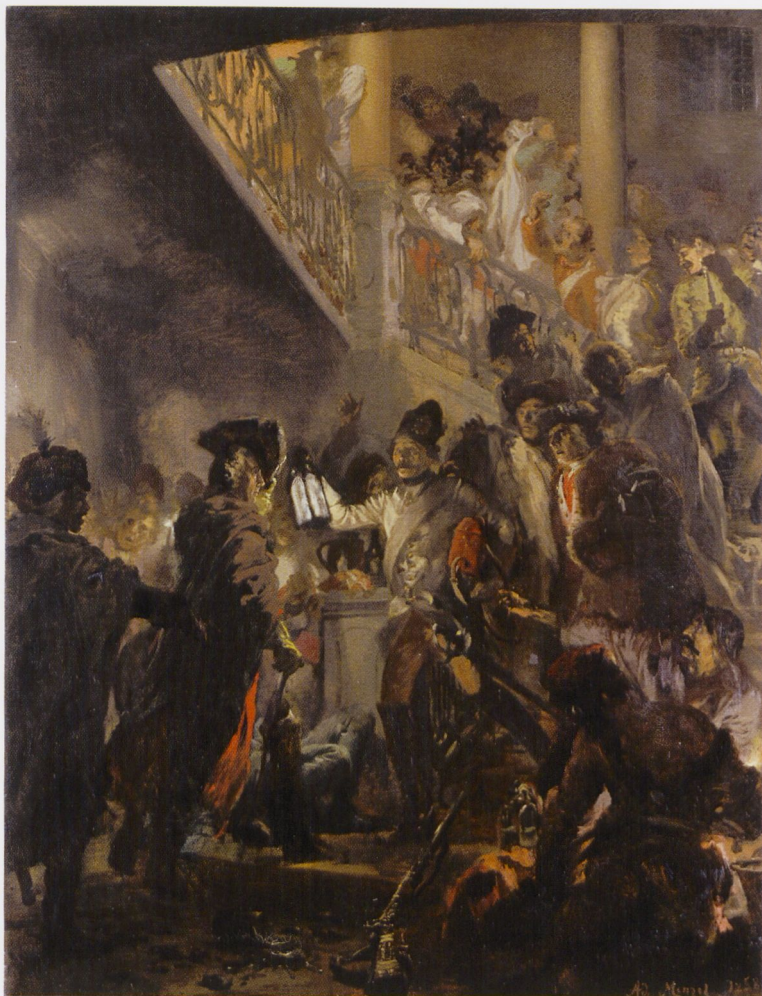
3 Adolph Menzel, Friedrich der Große in Lissa nach der Schlacht bei Leuthen (»Bon soir, Messieurs«), 1858 Öl auf Leinwand, 247 × 190,5 cm Hamburg, Hamburger Kunsthalle